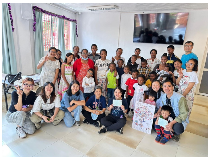
屯宣短宣隊與「毛公仔生命轉化計劃」家庭合照 (右下為宣教士家庭)

2025 年年底，屯宣更差派短宣隊來到工場，服侍十多個本地華人家庭，在長假期間為孩子們舉辦兒童營。短宣隊員全情投入、盡心竭力的服侍，令我們深受激勵。隊員們的探訪，也讓本地人深深感受到溫暖。對很多本地人而言，或許從未想過，遠在香港，竟然有一群基督徒願意親身來到他們中間，關心他們的需要。