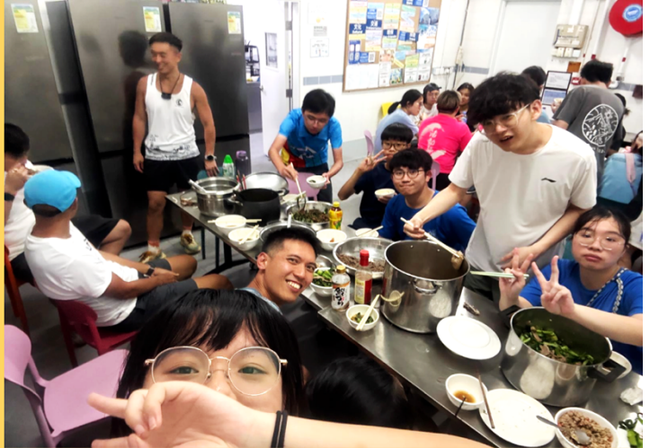
屯宣家書-靈修小品 2026.6 讀經：箴29:1-27